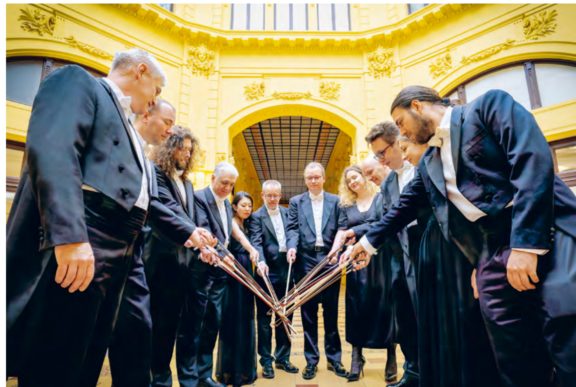
Zagreb Soloists, Foto: Ivan Mihaljević

Während des Kroatenkriegs gaben die Zagreb Soloists rund siebenzig Benefizkonzerte, unter anderem zugunsten der Stadt Dubrovnik, der zerstörten Musikschulen in Kroatien und des Kinderkrankenhauses Zagreb. Darüber hinaus wirkten sie an zahlreichen Festkonzerten anlässlich der Präsentation des neu gegründeten kroatischen Staates mit.