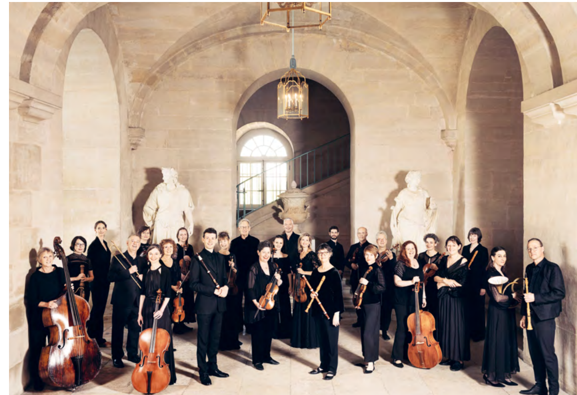
The Constellation Orchestra, Foto: Benjamin Ealovega

Die ambitionierten Projekte des CCO führen das Ensemble häufig auf internationale Tourneen. Dabei unterstreichen sie ihre Vielseitigkeit und ihr Streben nach künstlerischer Exzellenz, indem sie multidisziplinäre Veranstaltungen gestalten, die die Schnittstellen von Musik, Kunst und ökologischem Bewusstsein erkunden.