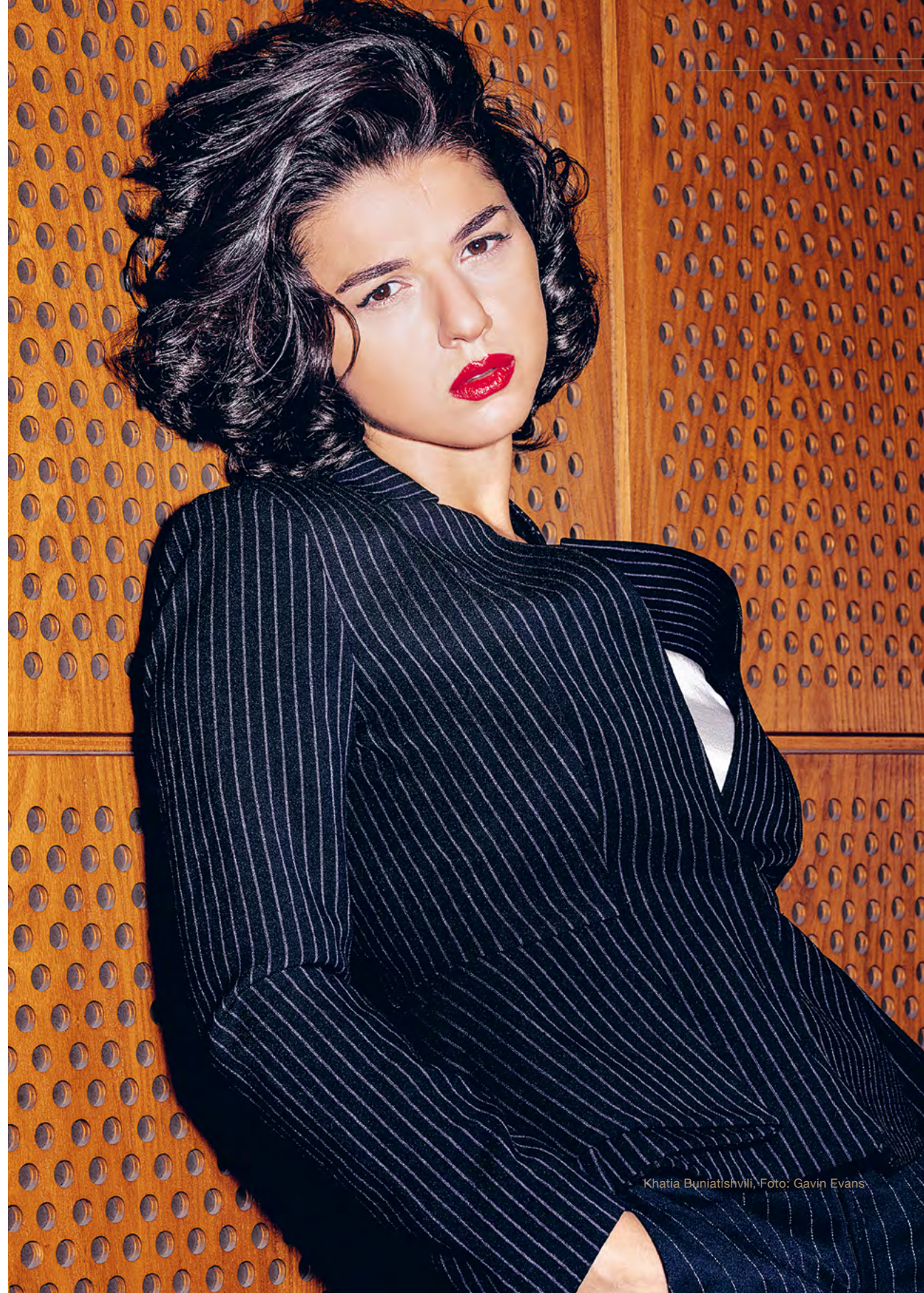
Khatia Buniatishvili, Foto: Gavin Evans

Ihre umfangreiche Diskographie bei SONY Classical umfasst die Alben „Franz Liszt“ (2011), „Chopin“ (2012), „Motherland“ (2014), „Kaleidoscope“ (2016), „Rachmaninoff“ (2017), „Schubert“ (2019), „Labyrinth“ (2020) und „Mozart: Piano Concertos Nos. 20 & 23“ (2024). Für ihre Alben „Liszt“ (2012) und „Kaleidoscope“ (2016) wurde sie mit dem ECHO KLASSIK ausgezeichnet. 2015 wirkte sie zudem am Coldplay-Album „A Head Full of Dreams“ mit.