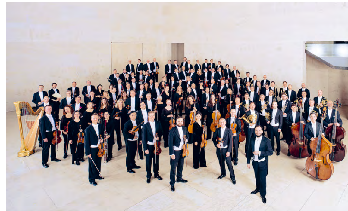
Wiener Symphoniker

Hauptsubventionsgeber der Wiener Symphoniker ist die Stadt Wien. Weitere Unterstützung erhält das Orchester vom Bundesministerium für Wohnen, Kunst, Kultur, Medien und Sport, von einzelnen Sponsoren sowie Spender:innen. Generalsponsorin ist die UniCredit Bank Austria AG.