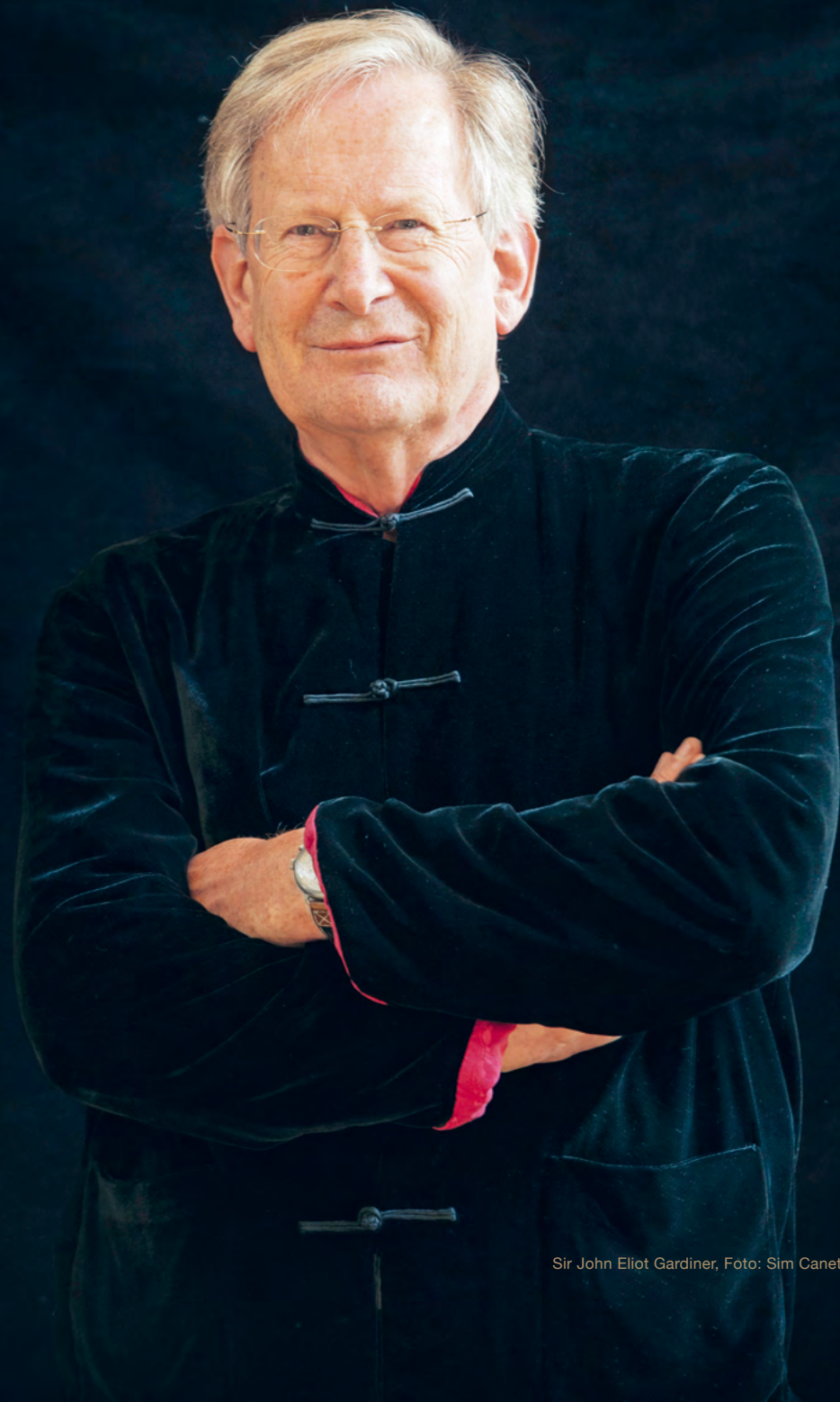
Sir John Eliot Gardiner

Die Bandbreite von Gardiners Repertoire zeigt sich in seiner umfangreichen, vielfach ausgezeichneten Diskografie mit eigenen Ensembles und führenden Orchestern wie den Wiener Philharmonikern, erschienen bei großen Labels wie Decca, Philips, Erato sowie in mehr als 30 Einspielungen für Deutsche Grammophon. Das Repertoire reicht von Mozart, Schumann, Berlioz, Elgar und Kurt Weill bis hin zu Werken der Renaissance und des Barock. Mit dem Monteverdi Choir und den Orchestern veröffentlichte Gardiner auf dem Label Soli Deo Gloria sämtliche Live-Aufnahmen seiner Bach-Kantaten-Pilgerreise aus dem Jahr 2000, für die er 2011 den Special Achievement Award des Magazins Gramophone erhielt.