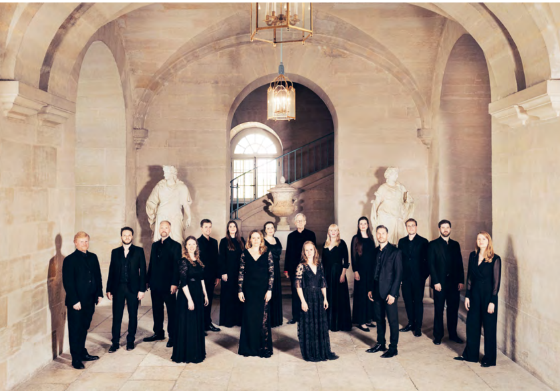
The Constellation Choir

Springhead Constellation, 2024 von Sir John Eliot Gardiner gegründet, versteht sich als lebendiges Kollektiv musikalischer Ensembles, kreativer Künstler:innen sowie Gestalter:innen, die sich der Neudefinition künstlerischen Schaffens im 21. Jahrhundert und der Förderung interdisziplinärer Erneuerung verschrieben haben. Im Zentrum unserer Mission steht das Streben nach Exzellenz, getragen von unseren Ensembles, die sich aus herausragenden internationalen Künstler:innen und Interpret:innen (der „Constellation“) zusammensetzen und unser Engagement für außergewöhnliche Qualität verkörpern.