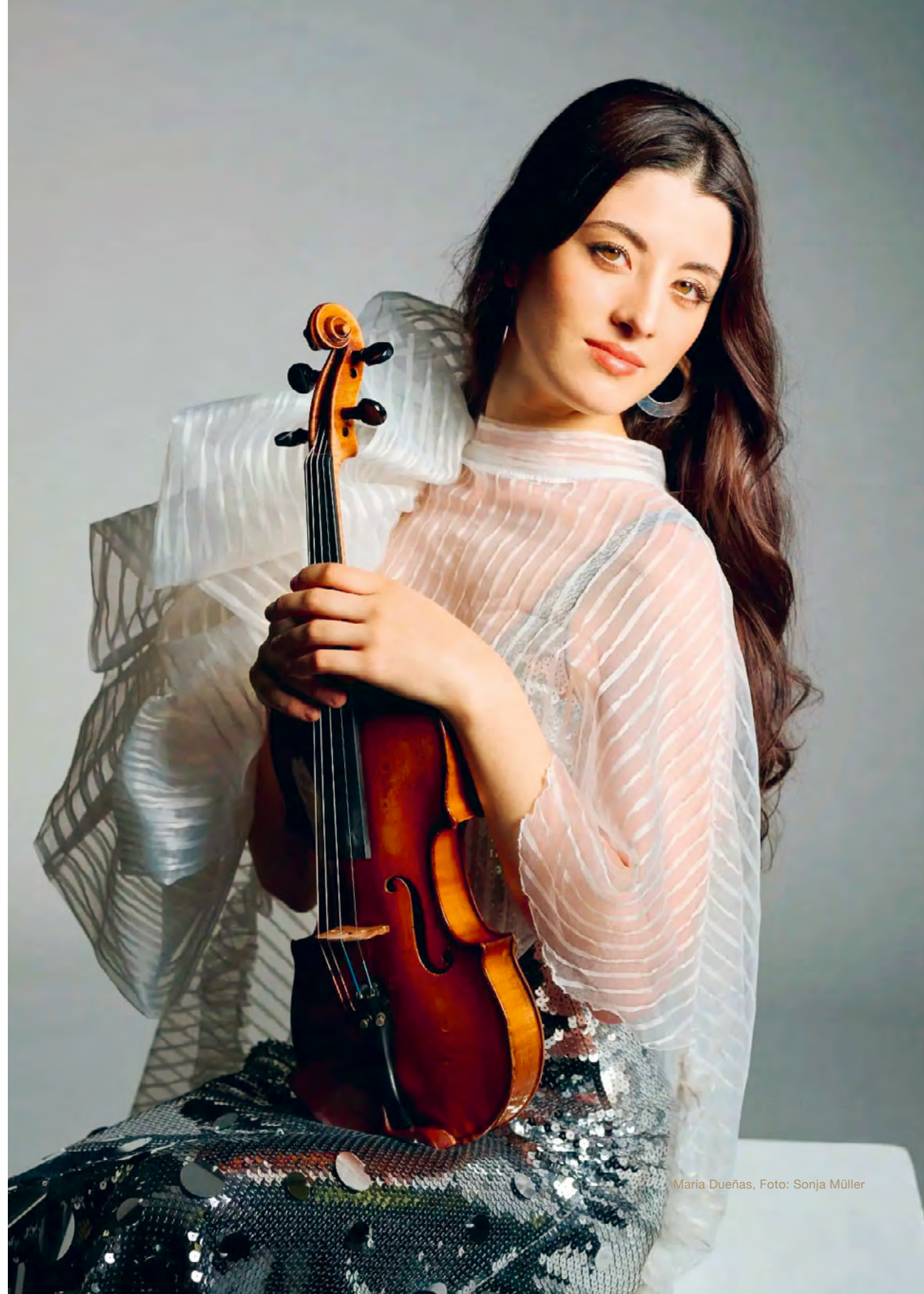
María Dueñas

Als weltweit anerkannte Solistin hat sie bereits mit den führenden Orchestern der Welt zusammengearbeitet, darunter die Staatskapelle Berlin, die Münchner Philharmoniker, das NDR Elbphilharmonie Orchester, die Bamberger Symphoniker, die Wiener Symphoniker, die Deutsche Kammerphilharmonie Bremen, San Francisco Symphony, Philadelphia Orchestra, Pittsburgh Symphony, Cleveland Orchestra, Oslo Philharmonic, NHK Symphony Orchestra, Swedish Radio Symphony Orchestra, Philharmonia Orchestra, Accademia di Santa Cecilia, Chamber Orchestra of Europe, Danish National Symphony Orchestra, die Dresdner Philharmonie und Orchestre de Paris. Dabei arbeitete sie mit einer Riege von hochgeschätzten Dirigenten wie Yannick Nézet-Séguin, Herbert Blomstedt, Christian Thielemann, Marin Alsop, Christoph Eschenbach, Manfred Honeck, Kent Nagano, Marek Janowski, Daniel Harding, Alain Altinoglu, Alan Gilbert, Cristian Măcelaru, Paavo Järvi, Vasily Petrenko, Andrés Orozco-Estrada, Santtu-Matias Rouvali, Jukka-Pekka Saraste, Vladimir Spivakov, Gustavo Gimeno und Antonio Pappano. Ihre enge künstlerische Partnerschaft mit dem Los Angeles Philharmonic und Gustavo Dudamel brachte mehrere bemerkenswerte Erfolge hervor, darunter ein Auftritt bei der 100-Jahr-Feier der Hollywood Bowl, die Uraufführung von Gabriela Ortiz' Violinkonzert